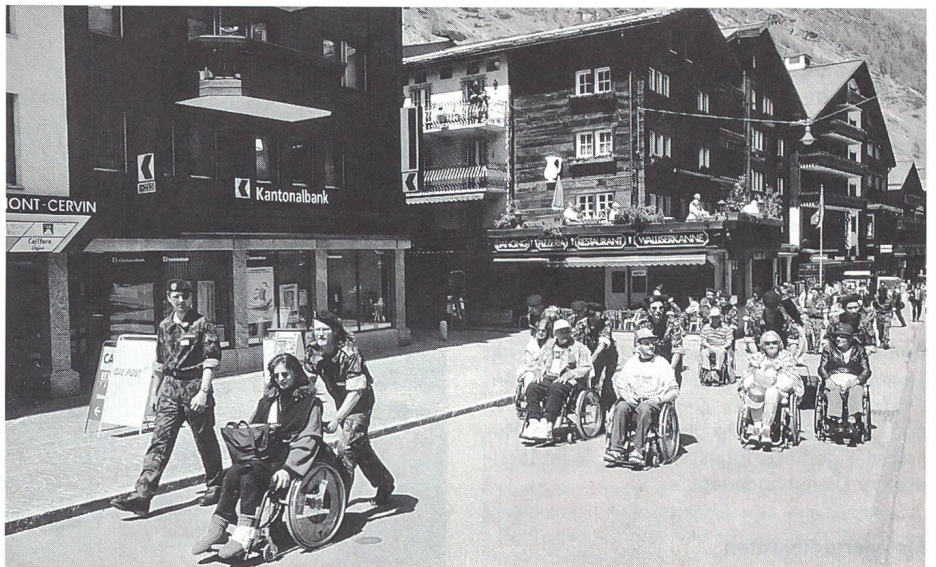
In der autofreien Bergstation Zermatt.