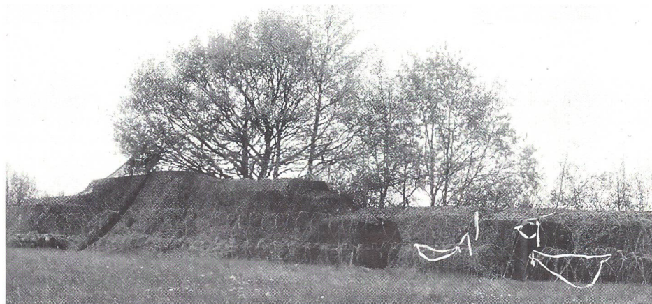
Der gut getarnte und mit Stacheldraht abgesicherte Radaroperationsteil.

Ebenfalls direkt im Stellungsraum befinden sich zwei Ortsmagazine. Das ist das Reparatur- und Ersatzmaterial für alle Komponenten. Dies erklärt auch die Bezeichnungen der TAFLIR-Mannschaft. Die Radargerätemechaniker TAFLIR, RG TAF, und UG TAF (Übermittlungsgerätemechaniker TAFLIR) sind Betreiber und Instandhalter in Personalunion. Die AdA sind