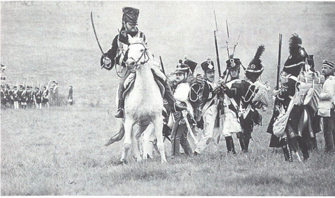
Preussischer Kavallerist attackiert französische Infanterie.