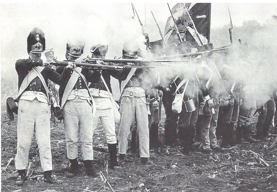
Französische Infanterie eröffnet das Feuer.

Für die 200-Jahr-Feier der Doppelschlacht im Jahr 2006 rechnet man mit einem militärischen Grossaufgebot.