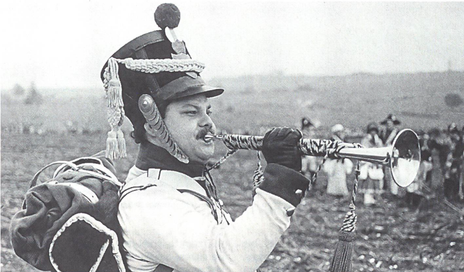
Trompeter bläst den Zapfenstreich.