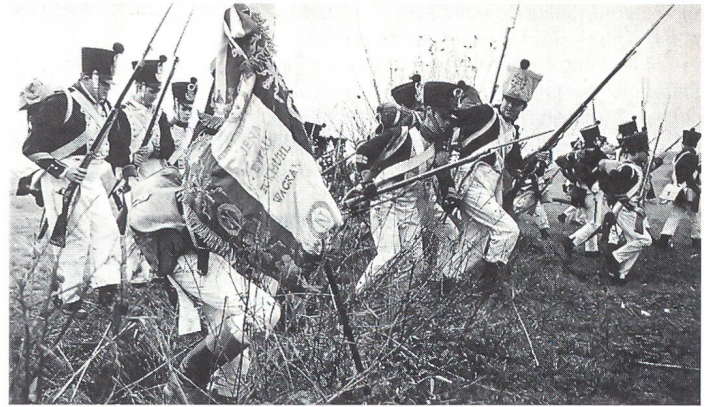
Französische Infanterie im Sturmangriff.