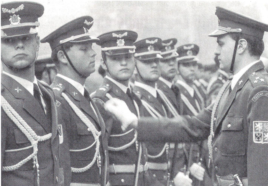
Prag am 8. Oktober 1993: Am Anzug eines Soldaten der tschechischen Ehrengarde werden die letzten Korrekturen vor dem Empfang des deutschen Verteidigungsministers vorgenommen.

In den vergangenen drei Jahren hat die tschechische Armee Veränderungen durchmachen müssen wie nie zuvor in ihrer Geschichte. Die neuen politischen Gegebenheiten verlangten Truppenverlegungen in grossem Umfang, gleichzeitig wurden die Mannschaftsstärke und die technische Ausrüstung erheblich reduziert. Die dramatische Situation des Jahres 1992 mit der Trennung der tschechischen und slowakischen Landesteile und der Errichtung zweier souveräner Staaten stellte die Armee vor die Aufgabe, in kurzer Zeit die politische Spaltung nachzuvollziehen. Die vorgegebenen Ziele wurden bis Ende 1992 erreicht. Seit dem 1. Januar 1993 marschiert die tschechische Armee auf ein neues Ziel zu, die Integration in die NATO, die nach den Wünschen der Politiker lieber morgen als übermorgen vollzogen werden sollte.