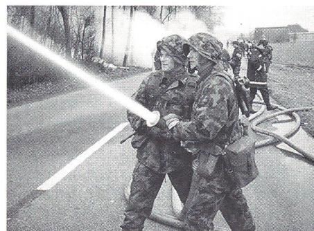
Mit grossem Druck wird das Wasser auf die supponierten Zisternenwagen gespritzt.