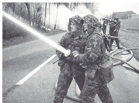
Mit grossem Druck wird das Wasser auf die supponierten Zisternenwagen gespritzt.