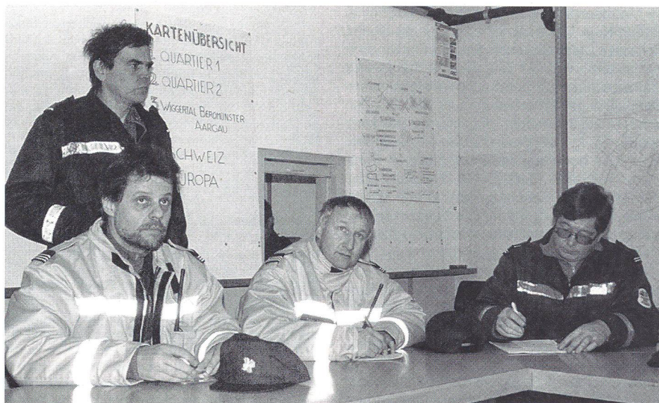
Die Feuerwehrkommandanten von Oftringen, Aarburg und Rothrist beim Abspracherapport.