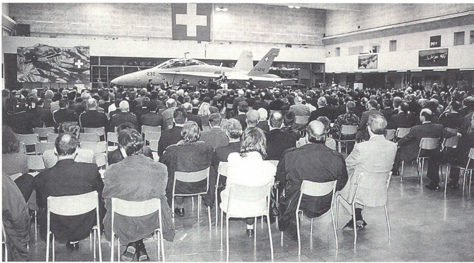
Während der Feier.

Mit der Übergabe des in der Schweiz montierten Kampfdoppelsitzers F/A-18D (J-5232), der am 3. Oktober 1996 seinen Jungfernflug erfolgreich absolviert hat, beginnt nun die plangemässe Auslieferung von der Gruppe Rüstung an die Luftwaffe: Im monatlichen Takt geht eine Maschine an die Luftwaffe, so dass 1997, 1998 und 1999 je eine Staffel ihre operationelle Bereitschaft erreichen wird. Mit Bundesbeschluss vom 17. Juni 1992 hat das Parlament einen Verpflichtungskredit von 3,495 Milliarden Franken zur Beschaffung von 34 F/A-18-Kampfflugzeugen bewilligt. Am 6. Juni 1993 haben Volk und Stände die Initiative «Für eine Schweiz ohne Kampfflugzeuge» abgelehnt und damit den Weg für die Beschaffung freigegeben. Von den 34 Flugzeugen wurden ein Ein- und ein Doppelsitzer in den USA fertiggestellt. 32 Kampfflugzeuge werden bei der SF Schweizerische Unternehmung für Flugzeuge und Systeme in Emmen endmontiert. Die Schweizer Industrie ist an der Herstellung im Umfang von rund 320 Millionen direkt beteiligt. Der Flugzeughersteller McDonnell Douglas wurde ausserdem vertraglich verpflichtet, rund 2,3 Milliarden Franken durch Gegengeschäfte mit der Schweiz bis ins Jahr 2003 auszugleichen. Bis heute konnten rund 290 Schweizer Unternehmen indirekte Gegengeschäfte von 1,4 Milliarden Franken realisieren.