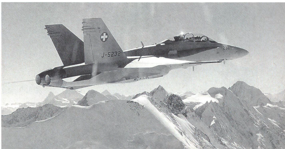
In Sion wird erstmals der Bevölkerung das neue Kampfflugzeug der Schweiz, der F/A-18, vorgestellt.

Das Kampfflugzeug F/A-18 reiht sich in die Palette von Hochleistungssystemen ein, die in jüngster Zeit beschafft wurden oder in den nächsten Jahren beschafft werden. Dieser technische Erneuerungsprozess unterstreiche, so Bundesrat und EMD-Chef Adolf Ogi, dass die Armee fähig und willens sei, in den Zeiten des Wandels die richtigen Antworten, Strategien und Konzeptionen zu entwerfen. Bundesrat Ogi: «Eine solche Armee verdient Vertrauen.» Was sie nicht verdiene, seien Abqualifizierungen von «Ewiggestrigen» in Armeefragen. Bundesrat Ogi erinnerte an die Abstimmung über die «Initiative für eine Schweiz ohne Kampfflugzeuge» vom 6. Juni 1993: An diesem denkwürdigen Tag haben