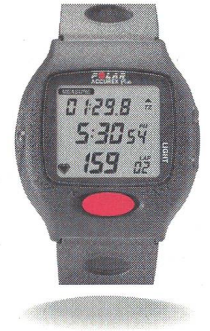
Polar Accurex Plus™