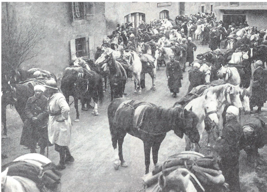
Mit dem am 19./20. Juni 1940 in die Schweiz übergetretenen 45. französischen Armeekorps gelangte auch die 2. polnische Spahibrigade mit ihren Pferden in unser Land und wurde interniert.

Im Sommer 1940 wurden von der Schweizer Luftwaffe je 4 Heinkel 111 und Messerschmitt 110 im Luftkampf zerstört respektive zur Landung gezwungen. Dies führte zu Wutausbrüchen von Hitler. In der Folge liess das Oberkommando des Heeres mehrere Invasionspläne ausarbeiten, die eine rasche Eroberung der Schweiz zum Ziele hatten. Hitler wollte ursprünglich die totale Abschnürung der Schweiz durch Deutschland und Italien erreichen. Dieses Vorhaben war fehlgeschlagen, weil es den deutschen Kräften nicht gelang, die Lücke bei Genf rechtzeitig vor dem Abschluss des Waffenstillstandes mit Vichy (Frankreich) zu schliessen und damit der Schweiz den direkten Zugang zu Vichy (Frankreich) zu blockieren. Die Operationspläne zur raschen Inbesitznahme des Schweizer Territoriums sind mehrmals überarbeitet worden. Dabei gingen die Planer von einem Kräfteinsatz von 4 bis 6