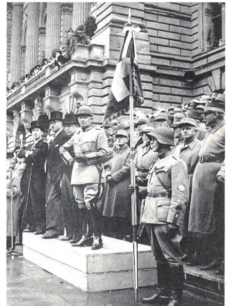
Am Tag der Fahnenehrung nahmen General Guisan, Bundespräsident von Steiger sowie die Bundesräte Kobelt und Celio den Vorbeimarsch der Fahnen ab.

General Guisan gab sein Mandat als Oberbefehlshaber nach ordentlich vollzogener De-