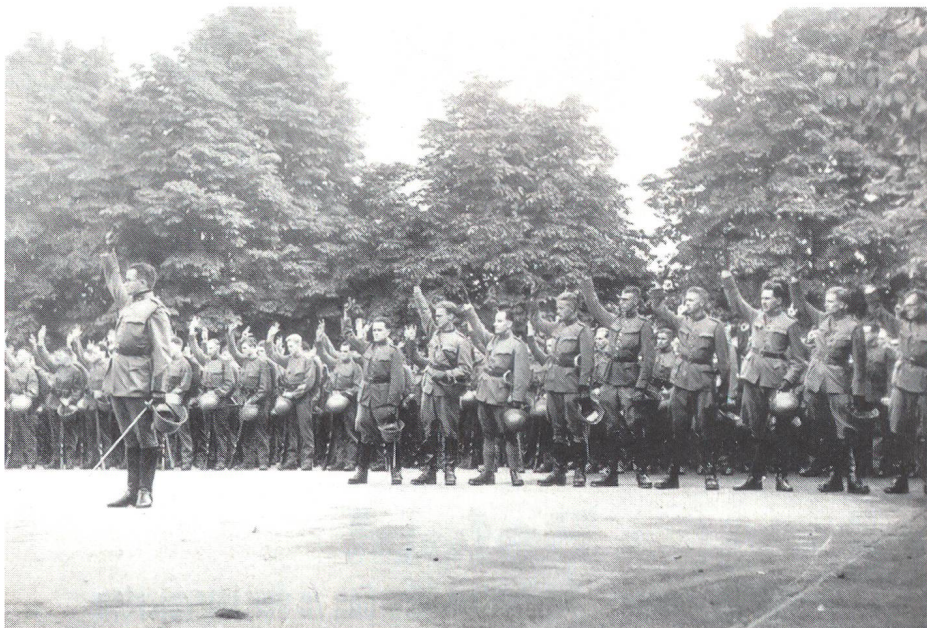
Unmittelbar nach dem Einrücken werden die Wehrmänner vereidigt.

Am 10. Mai 1940, als die deutsche Westoffensive losbrach, wurde die Remobilisierung der in der Zwischenzeit teilweise beurlaubten Verbände unverzüglich vorgenommen. Zunächst erfolgte die Konzentration der Kräfte des deutschen Angriffs im Raume Holland, Belgien und Nordfrankreich mit Hauptstossrichtung Kanal. Die zweite Phase der Schlacht um Frankreich führte das Panzerkorps Guderian über das Plateau von Langres von Westen her Richtung Schweizer Grenze. Gleichzeitig marschierte die bisher inaktive deutsche Südarmee unter Dollmann von Osten her über den Rhein entlang der Schweizer Grenze nach Westen. Durch diese Zangenbewegung wurde das 45. französische Armeekorps der 8. Armee, bestehend aus der 67. Infanteriedivision, der