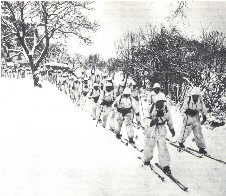
Skimanöver haben die Truppe mit den Bedingungen des Winterkriegs vertraut gemacht.

Mit der fortschreitenden Entwicklung des Kriegsgeschehens war es für Deutschland je länger, je wichtiger, die zentralen Alpenübergänge intakt unter dem Schutze der Schweizer Armee zu wissen, da die Pässe östlich und westlich der Schweiz von den alliierten Bomberverbänden unpassierbar gemacht wurden.