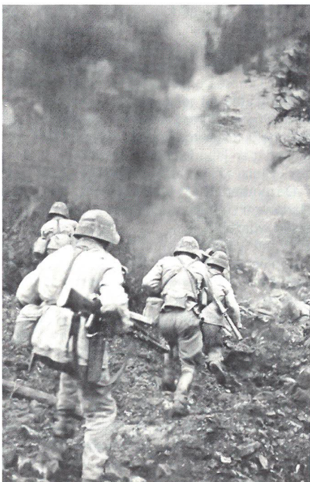
Das Ausbildungsprogramm der Infanterie verbreiterte sich gewaltig. Flammenwerfer unterstützten den Endkampf eines Stosstrupps.

So konnten wenigstens Versorgungs- und Verwundetentransporte der Achsenmächte in versiegelten Zügen durch die Schweiz gesteuert werden. Die Schweiz wiederum erhielt dadurch ein Gegendruckmittel, um von den