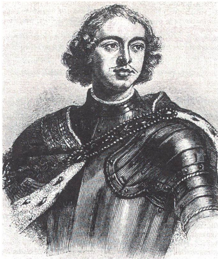
Der junge Zar

zung der Türken und der Verrat eines Überläufers führten zu einem Misserfolg dieses ersten Feldzuges. Man geht davon aus, dass mit dieser Niederlage der unaufhaltsame Aufstieg Peters zu einem der bedeutendsten Zaren begann. Erstens liess er sich durch Misserfolg nicht entmutigen, sondern neu inspirieren, und zweitens konnte er die Fehler erkennen und aus ihnen lernen.