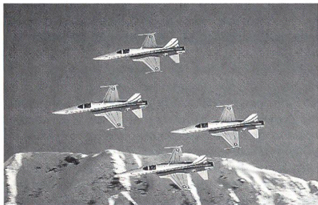
Die Patrouille Suisse beim Training auf der Axalp. Sie fliegt mit ihren sechs rot-weißen Tigern am 16. August nach Altenrhein.