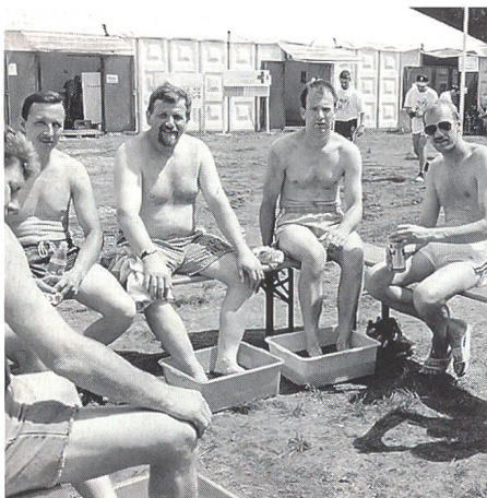
Ein sehr wichtiger Punkt: Pflege der Füsse nach dem Marsch.

Erstmals in der Geschichte konnten die Interlakner im Camp Heumensoord als erste Marschgruppe sämtliche Armeen starten. Im Mittelpunkt des dritten Marschtages standen die sieben Hügel zwischen Blasmolen und Bergen en Dal sowie der Besuch des kanadischen Soldatenfriedhofes von Groesbeek. In dieser Erde ruhen an die 2500 junge Kanadier, welche 1944 in der Schlacht um Arnheim durch Verrat in einen Hinterhalt der Wehrmacht gerieten und dabei, fern von ihrer Heimat, das Leben