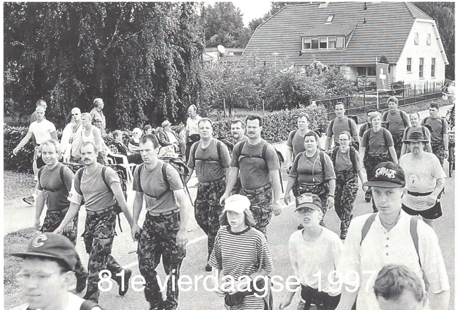
Motiviert und frohgelaunt nehmen die Interlakner und Argovianer gemeinsam den ersten Marschtag auf den Strassen in der Umgebung von Nijmegen in Angriff

Der vierte und letzte Tag begann mit einer um eine Stunde vorverlegten Tagwache. Ohne grössere Probleme nahm die Gruppe die letzten 40 km in Angriff. Vorbei durch bewaldetes Gebiet, über zahlreiche Brücken, führte die Strecke langsam, aber sicher dem ersehnten Ziel entgegen. Nach dem Durchmarsch von Cujk konnte die Maas mittels einer von den holländischen Pionieren erstellten Ponton-