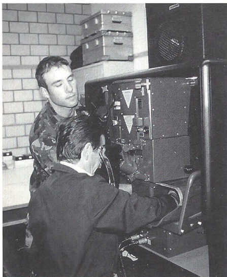
Am Einsatzsimulator durften sich die UOV-Gäste ebenfalls versuchen.

Der letzte Test für jedes Team ist der Orientierungslauf über 15 bis 20 km, der immer das ganze Klasesement nochmals durchschüttelt. Darin enthalten sind Distanzschätzen, Geländepunktebestimmen und Handgranatenwerfen sowie militärische Überraschungsdisziplinen. Aber auch das Orientieren selbst gestaltet sich anspruchsvoll. So wird alle drei bis vier Posten der Kartenmassstab gewechselt, zeitweise muss sogar nur nach Luftaufnahmen, nach Azimut und Distanz oder nach dem Gedächtnis gelaufen werden. Zusätzlich hat die Patrouille zwei Gewehre und eine Pistole mitzunehmen und startet