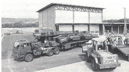
Die neue Basiswerkstatt für Schwimmbrücken und Rammgeräte.