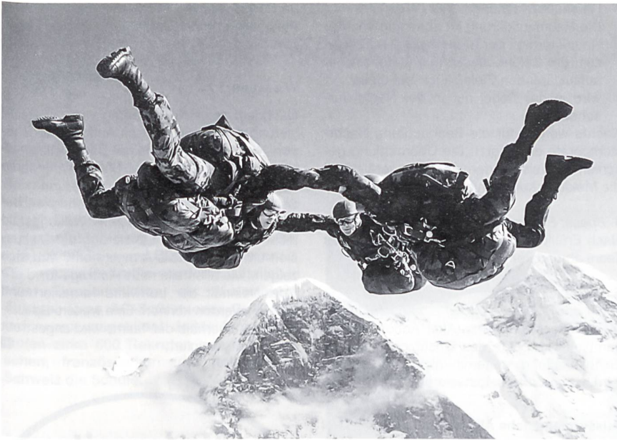
Freifall vor der Eiger-Nordwand.