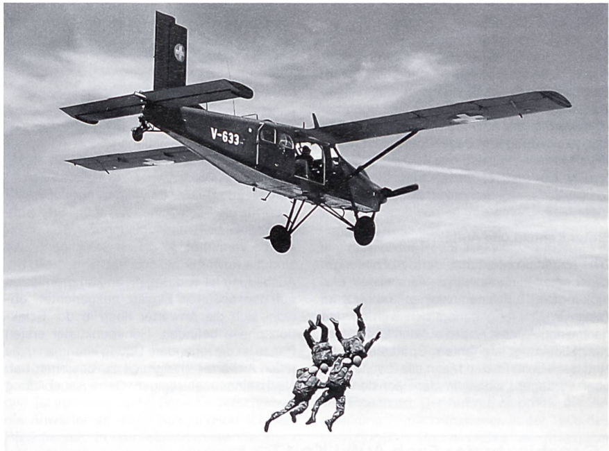
«Vierer-Stern» kurz nach dem Abgang.

Die Fsch Aufkl Kp 17 ist eines von diversen Aufklärungsmitteln des Armeekommandos für die Beschaffung von Informationen in der Tiefe des operationellen Raumes. Sie ist im Fliegerregiment 4 integriert und wird im Ernstfall gemäss den Bedürfnissen des Armeekommandos, der Armeekorps und der Luftwaffe durch den Kommandanten der Fliegerbrigade 31 eingesetzt. In den sechziger Jahren stellte die Schweizer Armee fest, dass der Bedarf an einer gut trainierten und speziell selektierten Spezialeinheit bestand. Diese Einheit sollte Sabotage- und Fernspäheinsätze ausführen. 1967 beschloss die Regierung, eine bis zwei solcher Spezialeinheiten zu bilden. In der Folge wurden Schweizer Offiziere und Unteroffiziere an Trainings- und Ausbildungskurse ausländischer Armeen geschickt. Nach ihrer Rückkehr entwickelten sie ein Konzept für die Ausbildung, Technik und Ausrüstung der Schweizer «Paras». Es war von Beginn an klar, dass