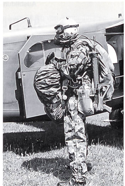
Hochgleitensatz-Ausrüstung MT-1X mit Sauerstoff. Der Rucksack wird vorne getragen.

Bis zum ersten Selektionsrapport nach vier Wochen haben die Anwärter Zeit, die an sie gestellten Anforderungen zur vollsten Zufriedenheit zu erfüllen. Es werden nur die spezifisch für die Fsch Aufkl relevanten Elemente der regulären Grundschulung der Schweizer Armee vermittelt. In dieser Selektionsphase sind die Anwärter auf sich alleine gestellt. Die Ausbildung ist von Beginn an kompromisslos auf den späteren Einsatz ausgerichtet, obwohl sich die Anwärter noch in der Selektionsphase befinden. Höhepunkt der ersten Phase ist die legendäre Übung «Ironman», die jeder Anwärter erfolgreich zu bestehen hat. Nach einer mehrtägigen Gebirgsausbildung