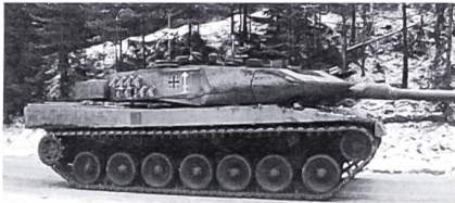
Leopard 2 A5

Im nächsten Waffenquiz werden moderne Kampfpanzer zu erkennen sein. Dazu gehören sicher die Typen M1 Abrams, Challenger, Leclerc, T72 und T80 sowie der Leopard 2. Besonders erwähnt sei der Leopard 2 A5. Diese kampfwertgesteigerte Version kommt dank ihrer Zusatzpanzerung in leicht anderer Aufmachung daher als gewohnt (siehe Bild).