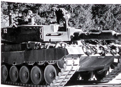
Emsige Bereitstellung unter erschwerten Bedingungen.

Inzwischen nehme ich die Funktion des Kp Kdt-Stellvertreters wahr, eine ebenso fordernde Aufgabe wie das Führen eines Zuges.