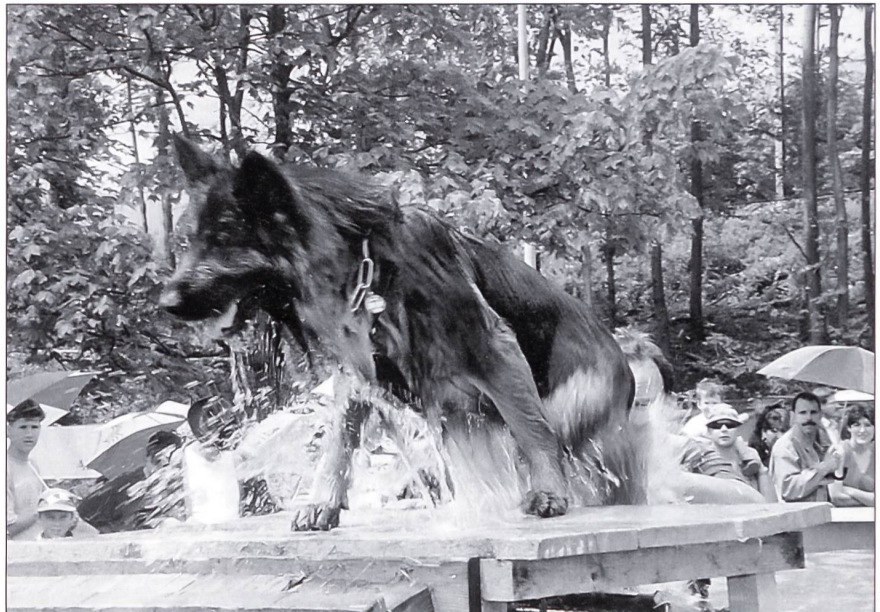
Trotz dem «Hindernisbad» verliert der Hund nicht sein Ziel.