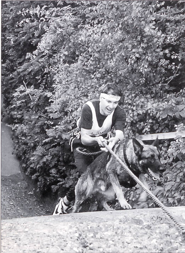
Gemeinsam schafft man jedes Hindernis.

(HAZ) in Bern (Sand) eingeladen. Schliesslich wurden 12 Anwärter ausgehoben, davon 6 mit eigenem Hund. Man darf schon jetzt von einem vollen Erfolg sprechen.