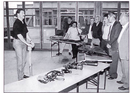
Die speziellen Waffen und Geräte der Sicherheitspolizei finden grosses Interesse.

Ihre Ermittlungsdienste sind in verschiedene Fachbereiche aufgeteilt: Vermögensdelikte, Sitt-