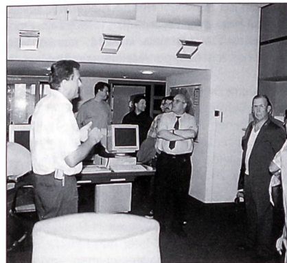
In der mit modernsten Mitteln ausgerüsteten Einsatz- und Meldezentrale laufen alle Fäden zusammen.