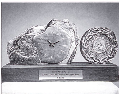
Der neue Gruppenwanderpreis, welcher von den Einheimischen aus Interlaken gewonnen wurde.