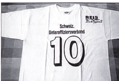
Das von der Ersparniskasse Interlaken gesponserte T-Shirt (herzlichen Dank) diente als Startnummer und durfte vom Junior als Souvenir nach Hause genommen werden.