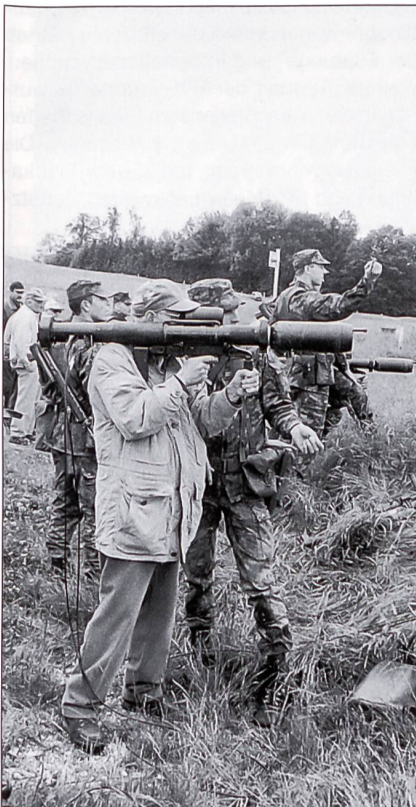
Die Ehemaligen versuchten sich mit der Panzerfaust.

Eine eindrückliche Demonstration boten die Soldaten beim Ortskampf. In Neuchlen-Anschwilen steht eine moderne Häuserkampfanlage zur Verfügung. Erstmals konnten die Soldaten der Gren Kp 31 mit dem Sturmgewehr-Simulator üben. Wie der Kommandant erwähnte, hat dies eine sehr gute Beeinflussung auf das Gefechtsverhalten und die Übungen werden realistisch. Es braucht jetzt keine Schiedsrichter mehr, um festzustellen, wer getroffen ist. Wer «piepst» ist getroffen, und es piepst so lange, bis der Soldat abliegt und liegen bleibt. Erst mit der Schiedsrichter-Pistole wird das Piepsen abgestellt. Im Vergleich zu früher sind die Soldaten viel vorsichtiger beim Stürmen der Häuser, respektive es wird nicht mehr gestürmt, sondern vorsichtig angeschlichen. Dabei muss der Rücken immer gedeckt sein, und der Anschlagwechsel wird geübt. In den Häusern sind in den verschiedenen Räumen automatische Gefechts-scheiben aufgestellt. Diese können so eingestellt werden, dass praktisch nonstop geübt werden kann. Wenn ein Soldat bei den ersten Scheiben vorbei ist, stehen die Scheiben wieder auf und der nächste kann sein Training beginnen. Neben den Scheiben werden auch noch Marqueure eingesetzt. Bei einem Angriff auf ein besetztes Haus muss mit bis zu 70 Prozent Verlust gerechnet werden. Das Training hat eine