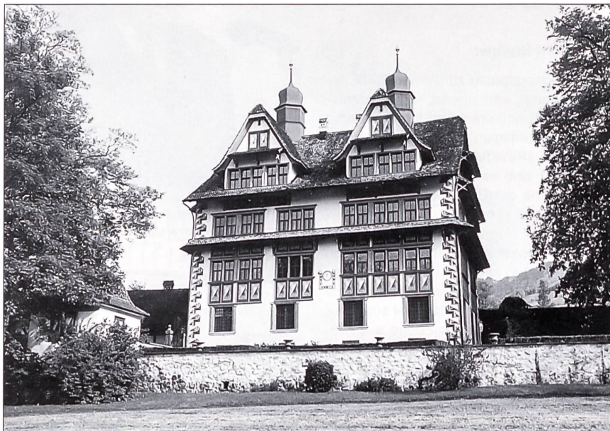
Das prachtvolle «Ital-Reding-Haus» in Schwyz.

Das «Ital-Reding-Haus» gehört zu den prunkvollsten Profanbauten des Landes Schwyz. Erbaut wurde es ab 1609 durch Ital Reding. Er verstand es, in seinem Wohnhaus einheimische Bautradition mit damals modernen Architekturelementen zu einem harmonischen Ganzen zu verbinden. Dem Gebäude vorgelagert ist ein wunderschöner Barockgarten mit bucheingefassten Rabatten. Oberst Josef Wiget verstand es ausserordentlich gut, in le-