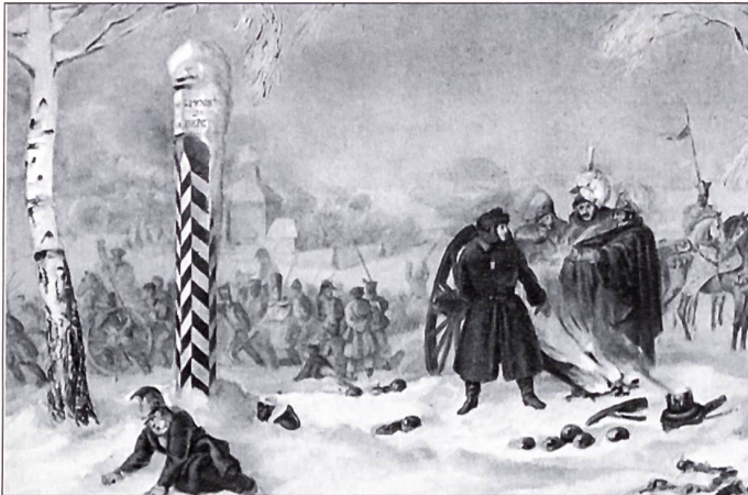
Offiziere der französischen «Grande Armée» am Feuer bei einer Marsch-pause auf ihrem Rückzug von Moskau im Winter 1812 (Gemälde)