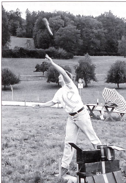
Ob wohl dieser perfekte HG-Wurf mitten im Ziel landen wird?

Wählbar aus sechs Disziplinen konnten der Ein-, Zwei- oder Dreikampf bestritten werden. Daneben wurden Gruppenwettkämpfe angeboten. Einzelne Sparten waren mehr auf Ausdauer