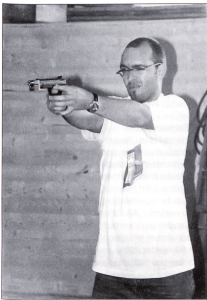
Volle Konzentration und ein gutes Auge werden vom Schützen beim Pistolenschiessen...