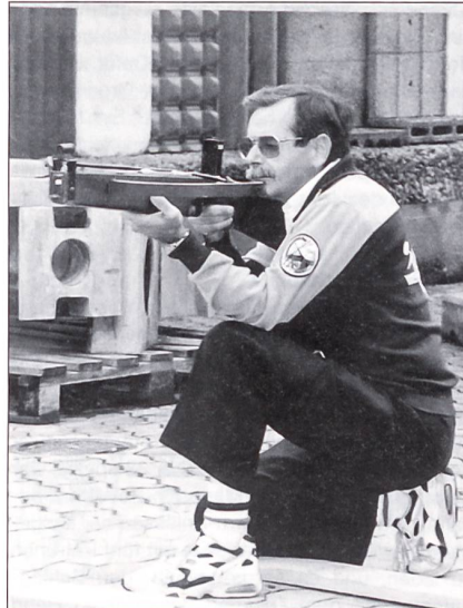
... und beim Armbrustschiessen verlangt.

dem nebst den Mitgliedern auch die breite Bevölkerung mitmachen durfte.