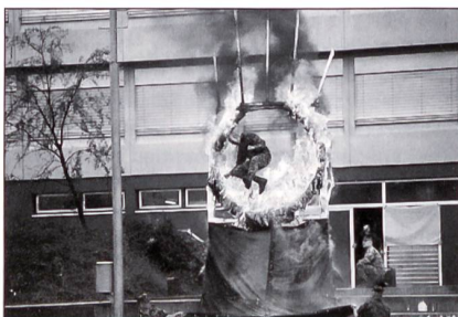
Grenadier bleibt Grenadier!

Erstaunlich waren auch die Leistungen der Territorial- und der Militär-Grenadiere; da sind die Bedenken der Politik diese Spezialisten entsprechend einzusetzen, wohl mehr als unbegründet. Solch hochmotivierte, gut ausgebildete Leute zur Unterstützung beispielsweise des Grenzwachtkorps einzusetzen, könnte man sich jedenfalls durchaus vorstellen.