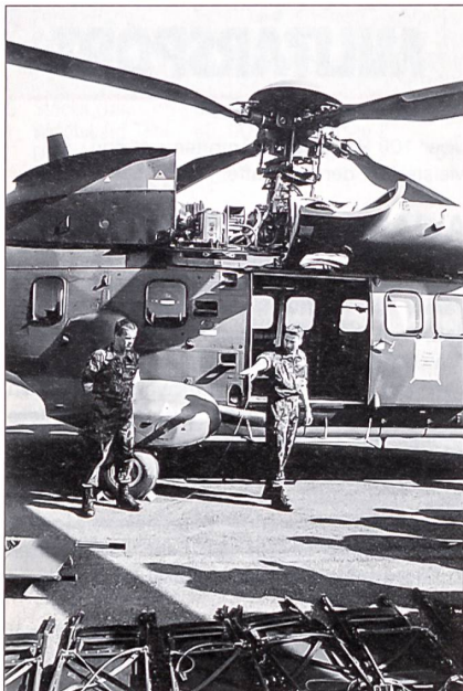
Die Flieger-Boden-Truppen hatten in einem Wettkampfteil den Laderaum eines Super-Puma-Helikopters möglichst schnell umzurüsten.

auch die Wettkampfaufgaben, welche die Patrouillen aus den verschiedenen Verbänden und Fachgebieten lösen mussten. Es wurde in den Sparten wie Luftverteidigung, Luftaufklärung, Fallschirmaufklärung, Flieger Boden, 35-mm-Kanonenflab, Lenkwaffenflab Rapier und Stinger, Informatik, Übermittlung, Luftwaffenfusiliere usw. gekämpft. Die Meistertitel der vier Brigaden und deren verschiedenen Spartentitel wurden hier vergeben.