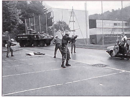
Festnahme von Verdächtigen durch die MP-Grenadiere

Die Instrukturen der Grenadierschule liessen sich jedenfalls für einen Tag bei ihrer Arbeit über die Schulter blicken und gaben den Kommandanten gute Tipps mit auf dem Weg. Echte Hilfen aus der Praxis, welche den Kommandanten ihre Arbeit bei der Truppe auch tatsächlich erleichtern wird.