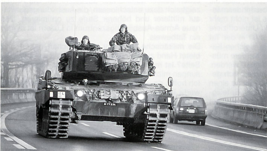
Am Morgen mussten alle Fahrzeuge die Weinlandbrücke bei Andelfingen überqueren.