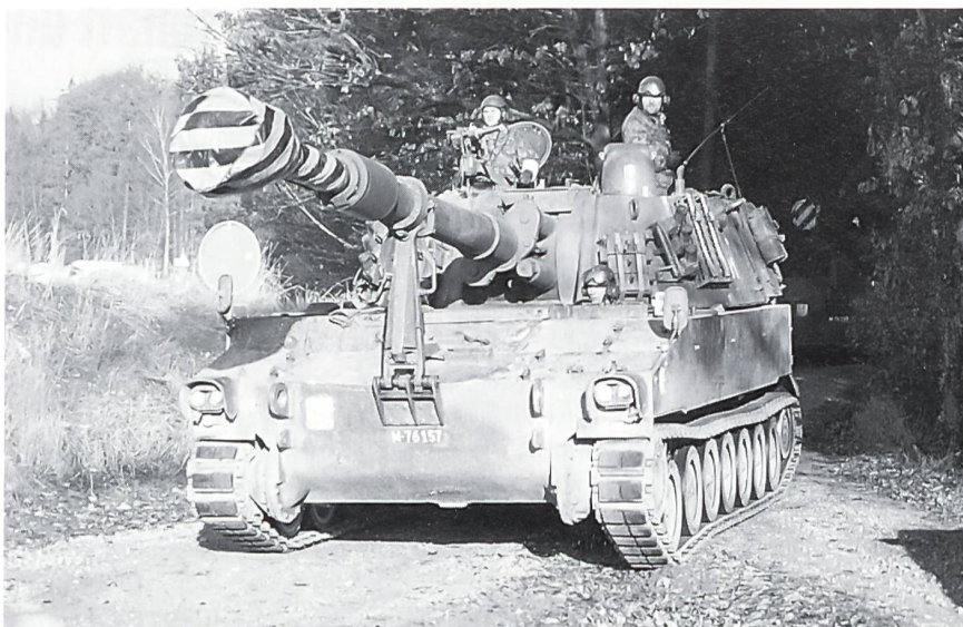
Die Panzerhaubitzen gehen in Stellung.

In den frühen Morgenstunden des Mittwochs trat die Übung in die eigentliche Schlussphase. Die Truppen mussten sich nun Richtung Flughafen Kloten bewegen. Die Artillerie bezog Stellung im Raum Henggart-Hettingen auf der alten N4, während die gepanzerter Verbände im Schutz der Artillerie sich lang-