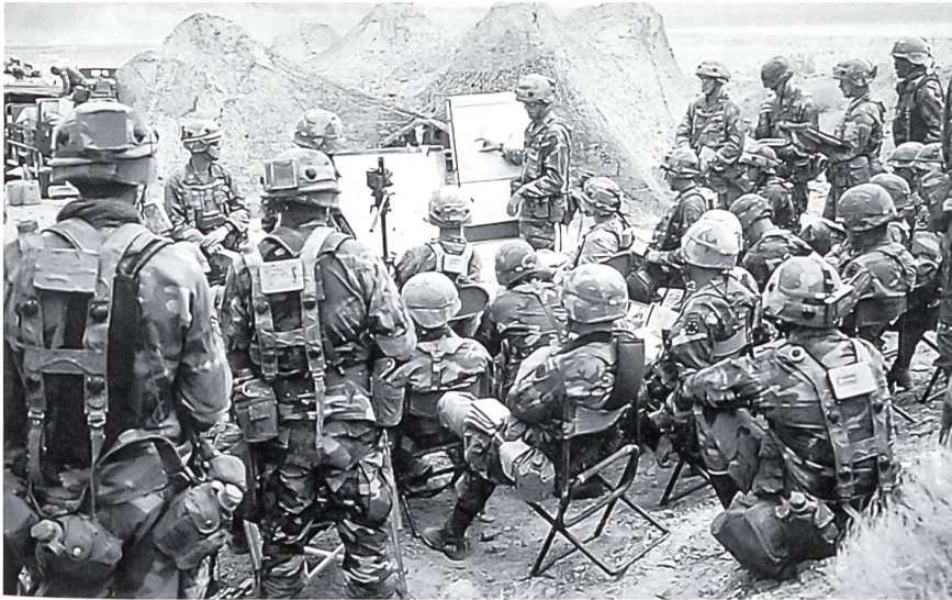
Übungsbesprechung im National Training Center Fort Irwin.

die grossen politischen Zusammenhänge zu erkennen. Als Chef Ausbildung einer Division kann ich einiges direkt umsetzen. Für meine berufliche Tätigkeit sind die Kontakte zu 75 verschiedenen Armeen von besonderer Bedeutung, insbesondere beim CISM (Conseil international du sport militaire).»