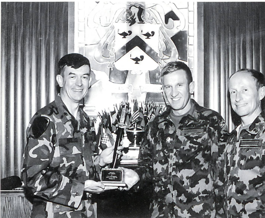
Brigadier Inge, Kdt des Command and General Staff College der US-Army, Oberst i Gst Oberholzer und Oberstlt i Gst Joss (v.l. n. r.) bei der Übergabe des Abschlussgeschenkes.

litärische Allgemeinbildung zu erweitern. Das erworbene Wissen im Bereiche Taktik werde ich als Stabschef umsetzen können. Als Instruktor werden, wo möglich, die Lernmethoden einfließen.»