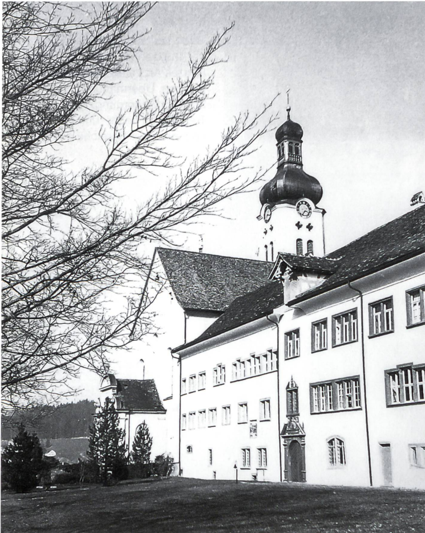
Die ehemalige Benediktinerabtei Fischingen – restauriert und als Tagungsort bestens geeignet.

Angesichts der Anstrengung konventioneller Kräfte in verschiedensten Regionen ist die strategische Allianz mit Europa unaufgebbar, bedarf aber auf europäischer Seite mehr globaler Interessenwahrnehmung. Die USA werden sich nicht wieder auf massive, landgebundene strategische Investitionen in Europa einlassen wie nach 1945, als sie im Kalten Krieg gefangen waren. Amerika bleibt Partner und Schutzmacht, aber den Europäern weniger berechenbar und von eigenen Interessen getrieben.