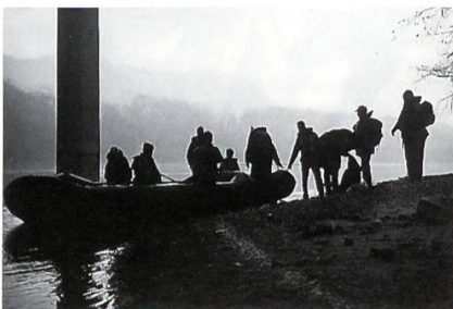
Stimmungsbild von der Übung «Beresina».

Das Detachement «Forelle» war am Treffpunkt eingetroffen. Der volle Rucksack liess erahnen, dass der Trupp bei der Beschaffung der Fische erfolgreich war. Sofort setzte das Boot über den Rhein, wo am andern Ufer bereits die Rauchfahne des Feuers aufstieg. Der Rastplatz war zu diesem Zeitpunkt bereits vorbildlich eingerichtet, und die Teilnehmer durften sich auf die bevorstehende Mahlzeit freuen. Einen kleinen Dämpfer erfuhren jedoch all jene Kameraden, welche sich auf eine fixfertig zubereitete Mahlzeit gefreut hatten, machte ihnen doch der Übungsleiter einen Strich durch die Rechnung. Kaum war der Rucksack mit den Fischen geöffnet, war augenblicklich klar, dass sich die Fische für die meisten Teilnehmer in einem ungewohnten Zustand befanden. Jeder der einen Fisch haben wollte (etwas anderes war nicht vorhanden), musste diesen selber ausnehmen und nach seinem Gusto entsprechend vorbereiten. Ein Gehilfe des Übungsleiters zeigte in der Folge, wie mit dem Messer einem Fisch zu Leibe gerückt wird und was beim Ausnehmen eines Fisches beachtet werden muss. Wenn auch mit etwelchem Widerwillen, beugte sich jeder Teilnehmer der ungewohnten Situation. Der «Überlebenstrieb» war offenbar doch grösser als die Abneigung, in die Eingeweide eines Fisches zu greifen und diesen mundgerecht vorzubereiten.