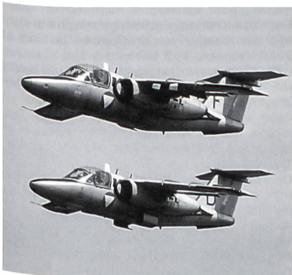
Die Voralberger Bevölkerung wird an der IBAS '98 erstmals Gelegenheit haben, ihre Saab 105-Militärjets auf dem Flughafen St.Gallen-Altenrhein hautnah am Boden zu bestaunen.

Das Flugprogramm der trinalationalen Airshow startet jeweils am Samstag und Sonntag um 10 Uhr mit klassischen Verkehrsflugzeugen, Oldtimern, Amphibienmaschinen und Transportern. Über die Mittagszeit folgen der Fallschirm-Massenabsprung mit über