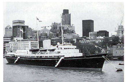
«HMY Britannia» bei ihrer Abschiedstournee vor dem Tower in London.

Während der 44 Jahre seit ihrer Indienststellung fuhr die «Britannia» beinahe 1,1 Mio. Seemeilen (über 2 Mio. km, über fünfmal die Entfernung Erde-Mond) und absolvierte 697 Staatsbesuche mit Mitgliedern der königlichen Familie an Bord. Allein in ihrem letzten Dienstjahr wurden 32 400 Seemeilen ins Logbuch der königlichen Jacht eingetragen, ein grosser Teil davon bei ihrer Reise nach Fernost, die mit der Ausfahrt aus Hongkong in der Nacht der Übergabe der ehemaligen Kolonie an China gipfelte. Doch auch für Englands Wirtschaft ist die Reise äusserst