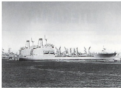
T-AO 195 «Leroy Grumman», ein Schwesterschiff der noch nicht fertiggestellten «Benjamin Isherwood».