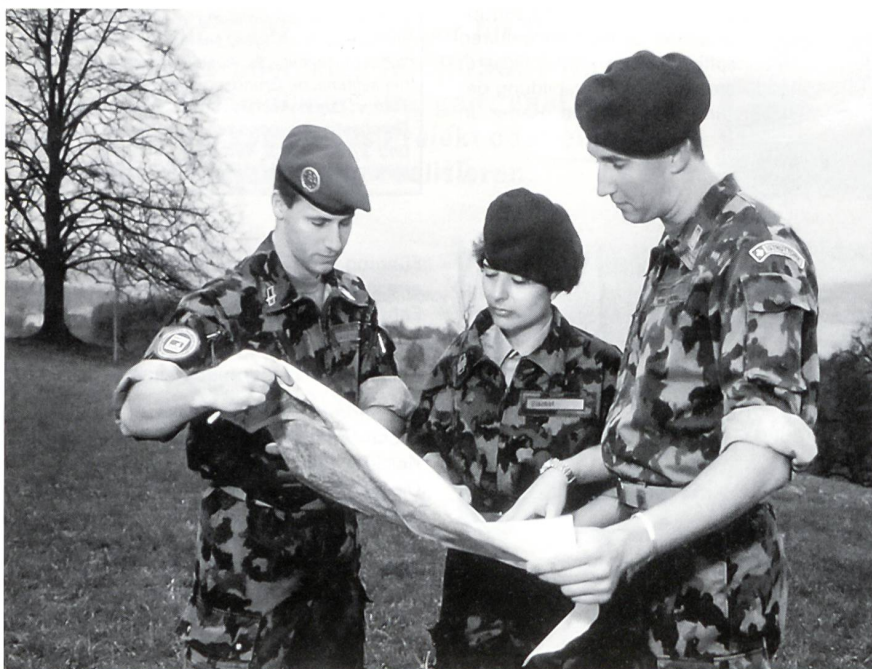
Gemischte Ausbildung auch an der Militärischen Führungsschule (MFS) in Au (bei Wädenswil ZH): Angehende Berufsoffiziere bei einer Übungsvorbereitung.

«Junge Korporale werden in der Ausbildung zum höheren Unteroffizier – Fourier oder Feldweibel – auf eine Funktion vorbereitet, deren Verantwortung auf Stufe militärische Einheit liegt, sei es als Rechnungsführer oder als Organisator. Die Fourier- und Feldweibel-Anwärter stehen meistens am Anfang ihrer beruflichen Laufbahn. Somit übernehmen sie in der Regel, verglichen mit dem Zivilleben, im Militär bereits eine höhere persönliche Verantwortung.»