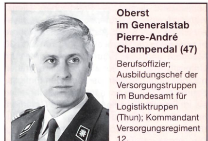
Oberst im Generalstab Pierre-André Champendal (47)

Der Schulkommandant – ein Berufsoffizier im Range eines Obersten oder Oberstleutnants – ist der Vorgesetzte aller Angehörigen einer Rekrutenschule und dem Ausbildungschef seiner Truppengattung unterstellt (z. B. Infanterie, Übermittlungs- oder Versorgungstruppen). Zum militärischen Lehrkörper gehören die Instruktionsoffiziere und -unteroffiziere. Die Berufsoffiziere stellen die Ausbildung der Truppe sicher und schulen die Kader in