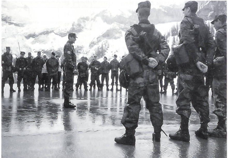
Übungsbesprechung nach einem Gefechtsschiessen der Mechanisierten Infanterie-Rekrutenschule auf dem Schiessplatz Hongrin VD.

Die mehr als 3600 Miliz-Vorgesetzten in den Frühjahrs-Rekrutenschulen bestanden aus zirka 2600 Korporalen (Gruppenführer), über 400 Leutnants (Zugführer), rund 180 Subalternoffizieren (Oberleutnant und einzelne