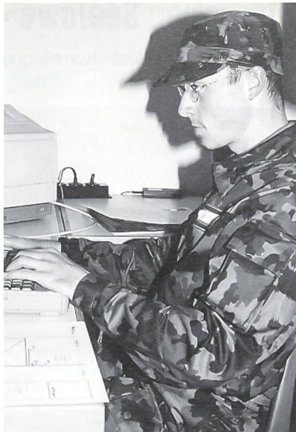
Erstellung des Zeitungs-Layouts.

Für das Informationsregiment gibt es keine Kursrhythmen wie in der übrigen Armee. Fast jedes Jahr leisten Offiziere, Unteroffiziere und Soldaten einen Dienst von einer Woche oder einmal zehn Tagen. Meistens zieht der Angehörige einer Medienkompanie die Uniform an, rückt ein und übernimmt im Militärdienst die gleiche oder ähnliche Tätigkeit wie im Berufsleben. Die Grenzen liegen bei den total zu leistenden dreihundert Diensttagen für die Soldaten. Der Bundesrat entscheidet zB bei einer Krise, wann und wieviel vom Rgt für die Erfüllung einer Informationsaufgabe notwendig sind. Im Katastrophenfall können für besondere Aufgaben der Orientierung Einsatzzüge pikettartig aufgebildet werden. Sie wären innert wenigen Stunden zB beim Radio einsatzbereit. Das Rgt verfügt über eine gros-