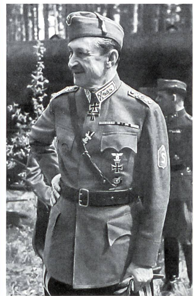
Die Aufnahme stammt aus der deutschen Propagandazeitschrift «Signal» (2. Oktober-Heft 1942).