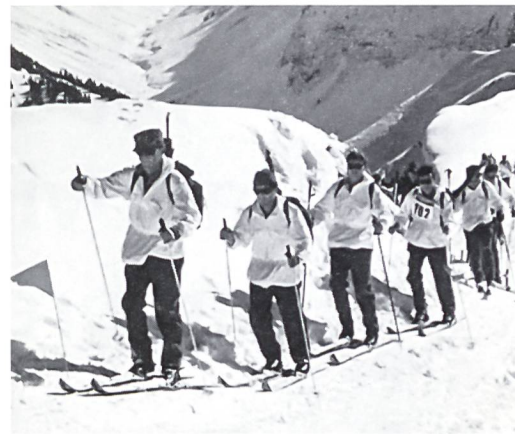
Unvergessliches Erlebnis in freier Natur: Zum Beispiel am Schweizerischen Winter-Gebirgs-Ski-lauf in der Lenk! Körperliche Anstrengung und Durchhaltewille werden belohnt durch das Naturerlebnis in der grossartigen Gebirgswelt des Ober-simmmentals und die Kameradschaft während dem zweitägigen Patrouillenlauf.

Eine gute ausserdienstliche Vorbereitung verhilft Dir zu einem sicheren Auftreten. Der Erfahrungsaustausch mit Kameraden hilft Dir, im Dienst auftretende Probleme zu meistern. Aber andererseits stärkt Dein Engagement in unseren Reihen auch die Stellung des Unteroffizierskaders in der Armee.