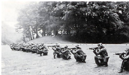
Die Neue Gefechtsschiesstechnik: Wer sie nicht regelmässig übt, kann sie nicht beherrschen! Die Aufnahme entstand am letztjährigen FWU 3 in Sankt Luzisteig.