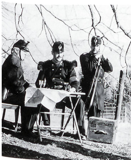
Ohne Geschichte keine Zukunft: Die Unteroffiziersvereine leisten einen wertvollen Beitrag zur Pflege der Tradition unserer Milizarmee. Unser Bild zeigt die historische Miliz des KUOV Zürich + Schaffhausen in der Uniform Ord. 1861, der Gründungszeit des SUOV.