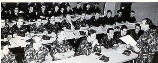
Alles andere als «graue Theorie»: Divisionär Beat Fischer instruiert die Teilnehmer des Führungsworkshops 1 in Stans.

(KUT), Konditionstrainings, Marche souvenir Général Guisan in Lausanne, Marsch um den Zugersee, Militärgeschichtliche Exkursionen, Militärischer Mehrkampf, Militärpolitische Informationsveranstaltung zum Thema Armee 200X, Morgartenschieszen, Nacht-Patrouillenlauf in Männedorf, Nidwaldner Sternmarsch, Präsidentenkonferenz des SUOV, Reusstalfahrt des UOV Emmen, Schweizerische Juniorenwettkämpfe, Schweizerische Unteroffizierstage (SUT 2001), Schweizerischer Wintergebirgsskilauflauf im Obersimmental, Schweizer Zweitagemarsch in Bern, Sempachschieszen des LKUOV, Sensler-Dreikampf, Skorelauf, Soldatenjahrzeit und Sempacherbot des LKUOV, St. Barbaraschiessen, Veteranentagung, Vorderladerschiessen mit Infanteriegewehr Ord 1859, Waffenlauf Thun, Zentralfest 2001... und vieles mehr.