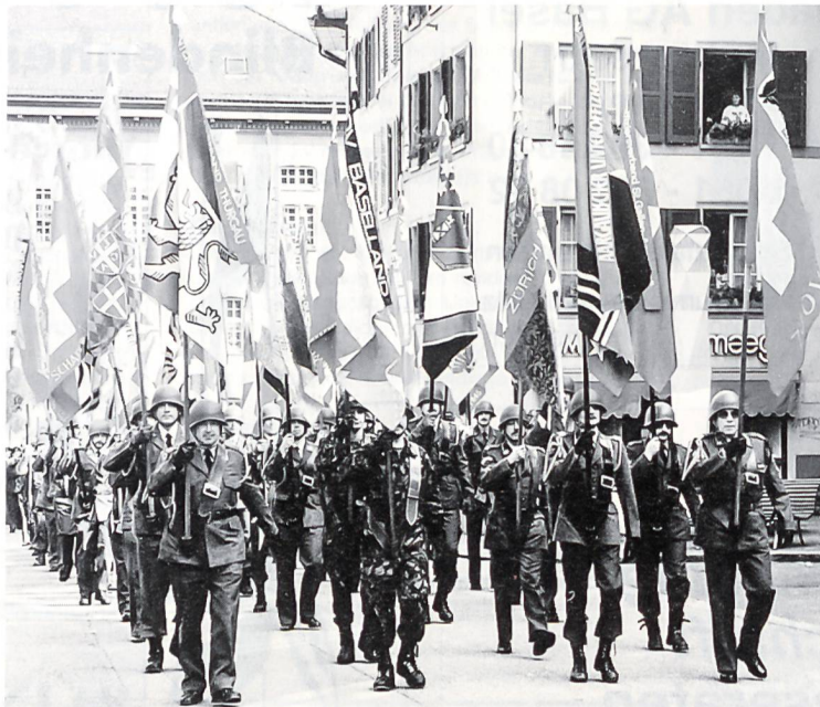
Einigkeit macht stark: Der SUOV vereinigt 150 selbständige Verbände, Vereine und spezialisierte Untersektionen aus allen Landesteilen. Unser Bild zeigt den Einmarsch der Fahnen und Standarten in Liestal anlässlich der Schweizerischen Unteroffizierstage (SUT) 1995.