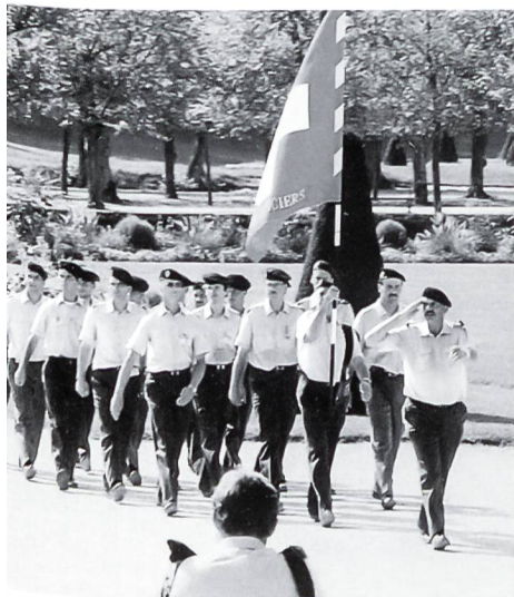
Sport ohne Grenzen: Unsere Zugehörigkeit zur «Association Européenne des Sous-Officiers de Réserve» bringt uns mit Kameraden aus anderen europäischen Ländern zusammen und schafft Freundschaften über die nationalen Grenzen hinweg. Unser Bild zeigt die SUOV-Equipe beim Defilee am AESOR-Wettkampf in Fontainebleau, Frankreich.