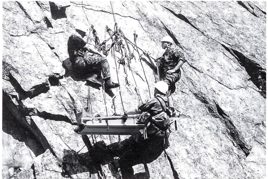
Rettung aus der Felswand.

Die Reform «Armee 95» hat die ZGKS stark aufgewertet, wurde sie doch für die Durchführung die Unteroffiziersschule und die