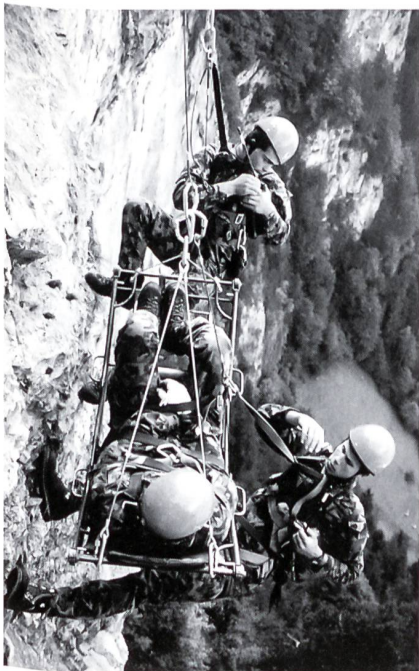
Retter, Helfer und «Verletzter» sind zum Aufseilen bereit.