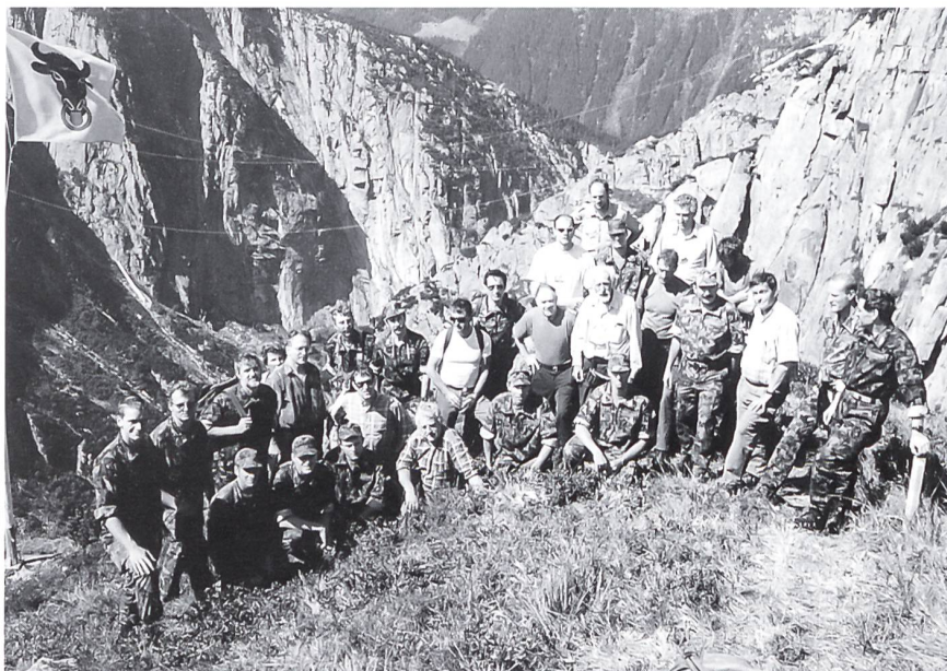
Die Teilnehmer der Erstbegehung der Via Ferrata «Diavolo» am 5.9.97

Begehung auf eigene Gefahr und Verantwortung!