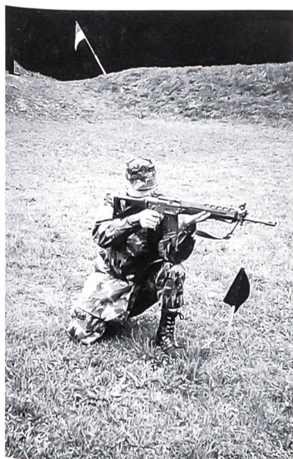
Schütze in tadelloser Stellung Kniend bei Schussabgabe.