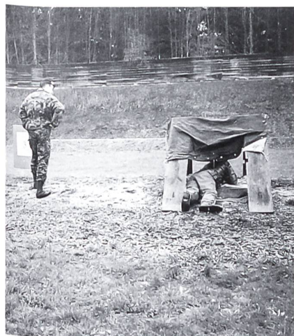
Gut beaufsichtigte Jungschützen beim Schiessen in Stellung Liegend frei mit dem Stgw 90.

Nach dem Ende der speditiv verlaufenen Delegiertenversammlung blieb noch genügend Zeit, damit sich die Gäste und Delegierten im Hotel «Linde», wo sie vorzüglich aus Küche und Keller verwöhnt wurden, der Pflege der Kameradschaft widmen konnten.