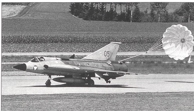
Österreichisches Kampfflugzeug Saab J-35 Draken bei der Landung in Payerne.