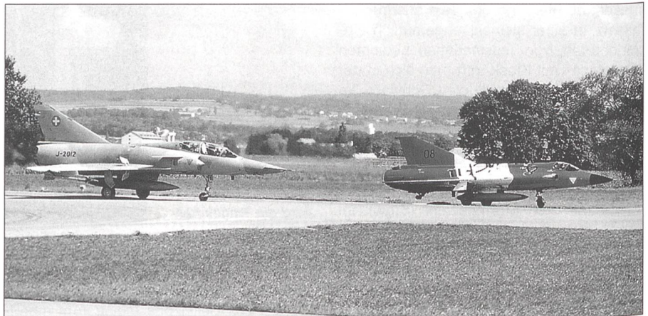
Eine Mirage III BS und ein Draken J-35 OE rollen nach einem gemeinsamen Einsatz auf der Piste von Payerne aus.

Für die Piloten beider Nationen stand während der Besucherwoche ein intensives Luftkampftraining auf dem Programm.