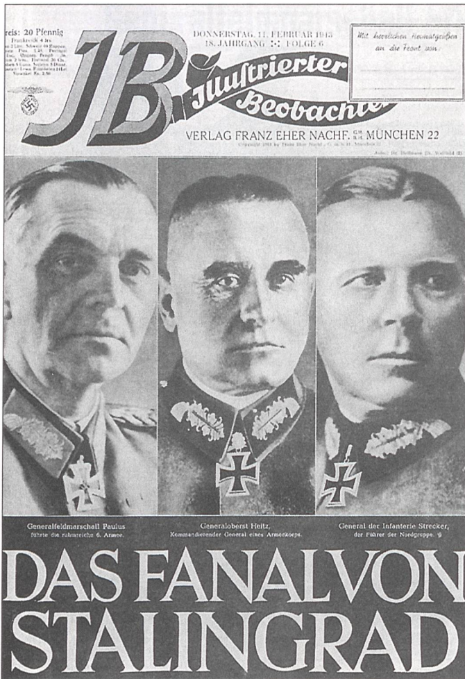
Das Fanal von Stalingrad.

zung der Kräfte und wollte seinen Vorstoss unterbrechen, um die ungeschützten Flanken abzusichern. Er wurde von Hitler abberufen und durch Feldmarschall von Weichs ersetzt. Hitler und seine Berater waren fest davon überzeugt, dass die russische Armee kurz vor dem Zusammenbruch stand und folglich die Auffächerung der Kräfte kein Risiko mehr darstellte.