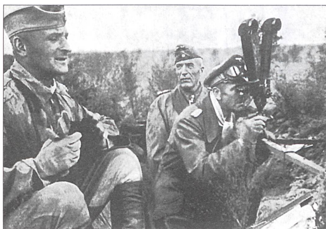
Generaloberst Paulus (am Scherenfernrohr), der Verteidiger im Kessel von Stalingrad.

raden zum Tode verurteilt wurden, erklärte sich Paulus bereit, für die sowjetische Propaganda zu arbeiten und als Mitglied des Nationalkomitees «Freies Deutschland» mit Radioaufrufen die Verbrechen von Hitler und dessen Regime aufzuzeigen und die kämpfenden Truppen zum Überlaufen zu bewegen. Am Nürnberger Kongress trat er als Zeuge auf. Aus der russischen Gefangenschaft im Jahre 1953 entlassen, liess er sich in der sowjetischen Besatzungszone von Deutschland nieder, griff öffentlich die Bestrebungen der westdeutschen Regierung zur Wiederbewaffnung der BRD an und kritisierte deren amerikafreundliche Politik.