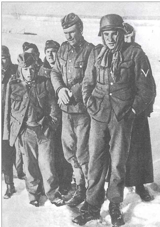
Gefangene deutsche Wehrmachtsoldaten an der Ostfront; gegen die Kälte in der Sowjetunion sind die Soldaten unzureichend geschützt.

Militärisch ausserordentlich begabt und interessiert, ein langsamer, sorgfältiger Arbeiter am Schreibtisch, mit einer Leidenschaft für Kriegs- und Planspiele am Kartentisch oder Sandkasten, bei denen er eine beträchtliche operative Begabung bewies, jeden Entschluss lange, gründlich und mit Sorgfalt zu überdenken, bevor er die entsprechenden Befehle herausgab.»