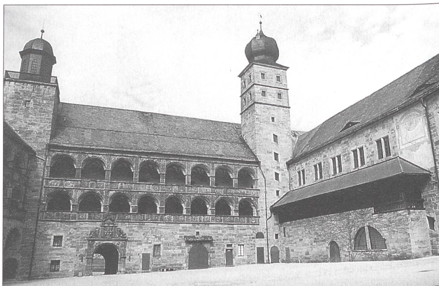
Der «Schöne Hof» der Plassenburg in Kulmbach.

Das oberfränkische Kulmbach ist die Stadt berühmter Biere. Die Schaffung eines preussischen Armeemuseums auf der Plassenburg war aber keineswegs eine «Bieridee». Ganz im Gegenteil, es liegt ein handfester historischer Bezug vor. So hiess es zur Ausstellung «Bayern & Preussen», die 1999 in Berlin und Kulmbach zu sehen war: «Bayern und Preussen – das bedeutet nicht nur Hauen und Stechen, Granteleien und scharfzüngigen Spott, Un-