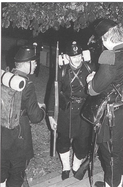
Die Compagnie 1861 macht sich für den Ehrensalt bereit.