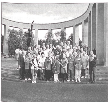
Die Reisegruppe am Eingang zum amerikanischen Soldatenfriedhof.

Der dritte und vierte Tag galt dem Besuch der Landungsstätten der Alliierten vom 6. Juni 1944. Interessiert hörten wir den Ausführungen der örtlichen Reiseleiterin zu, welche über die Ereignisse von damals ausführlich berichtete. Die Abschnitte um Arromanches-les Bains «Utah», «Juno», «Sword» und «Omaha-Beach» zeigen noch heute Spuren. Tief bewegt waren wir alle beim Besuch des 70 Hektar grossen Soldatenfriedhofes von Omaha-Beach, wo gegen 10 000 amerikanische Soldaten ruhen. Beeindruckt war jeder Teilnehmer aber auch vom Cinéma d'Arromanches und vor allem dem «Mémorial für den Frieden» bei Caen, welches täglich von mehreren hundert Menschen aus aller Welt besucht wird. War bis jetzt unsere Reisegesellschaft in froher Stimmung, verliess man das Haus eher gedrückt und stellte sich die Frage, wie war es möglich, dass ein Weltkrieg, welcher so viel Leid und Trauer über die Menschheit brachte, überhaupt stattfinden konnte. Warum haben die Politiker in aller Welt bis heute noch nichts daraus gelernt?