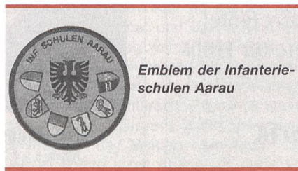
Emblem der Infanterieschulen Aarau

Die neue Org der Ausb in den RS hat sich in dieser, wie auch in den vergangenen Schulen, bewährt. Die ersten drei RS-Wochen Allg Grundausb (AGA) ohne Grfhr, konnten die Zfhr dank der Unterstützung durch einen jungen WK Kpl (erstmalig 1 WK Kpl pro Z) und von der Schule vorgegebenen Programmen und Zugsarbeitsplätzen, organisatorisch gut bewältigen. In den restlichen 7 Wochen der Grundausbildung, welche mit Schwergewicht der Ausbildung der Unterwaffengattungen Füs, PAL, Mitr und 8,1 cm Mw gewidmet