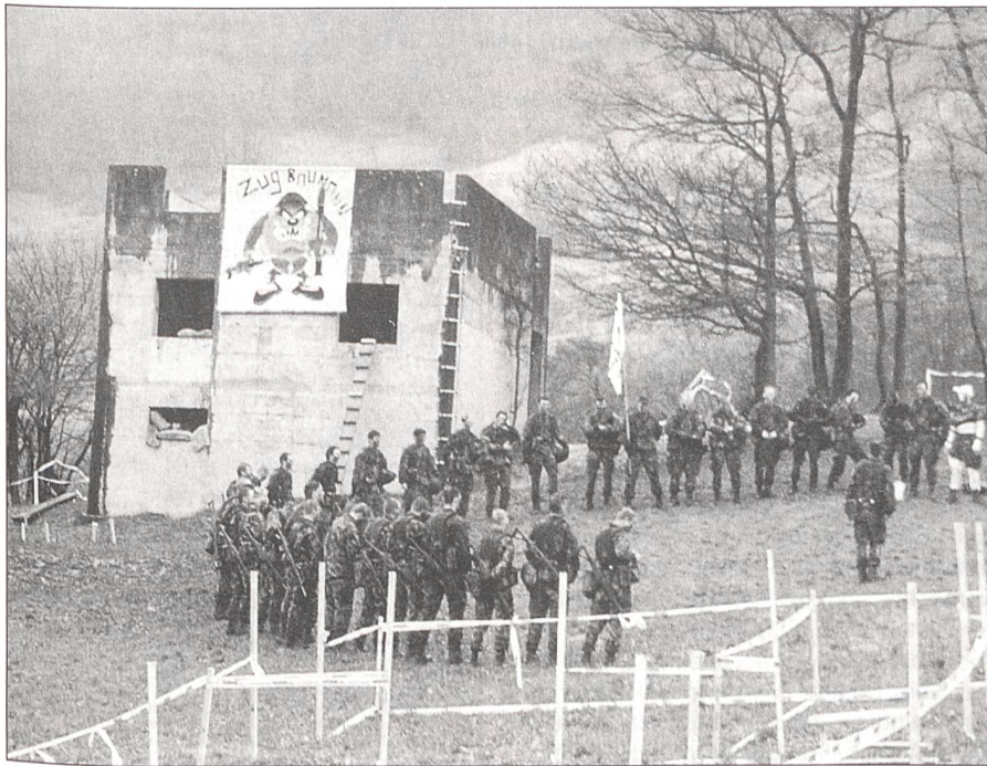
Übungsbesprechung nach Häuserkampf

auch Aargauer. Nach dem Bezug der Zimmer erfolgt das erste Kennenlernen der Leute, mit denen man für die nächsten vier Monate die Zeit verbringt und, man kommt zum raschen Schluss, dass diese gar nicht so übel sind.