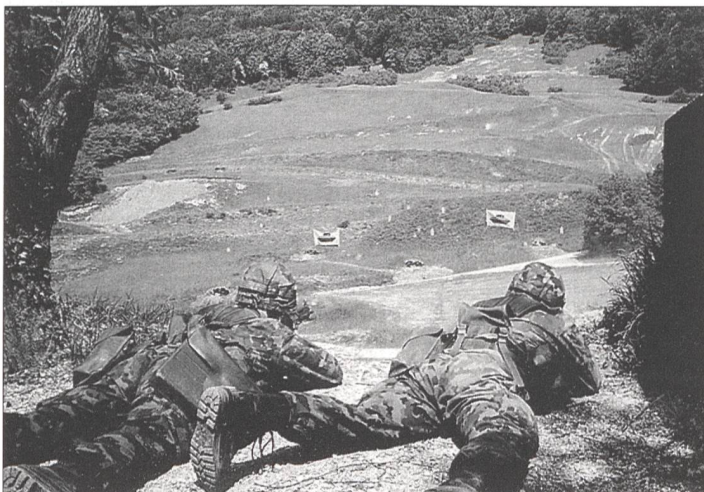
Füsilier als Einzelkämpfer in einer Gruppenübung.

Die Lehrfreiheit eines Zugführers während der Detailausbildung besteht nicht etwa