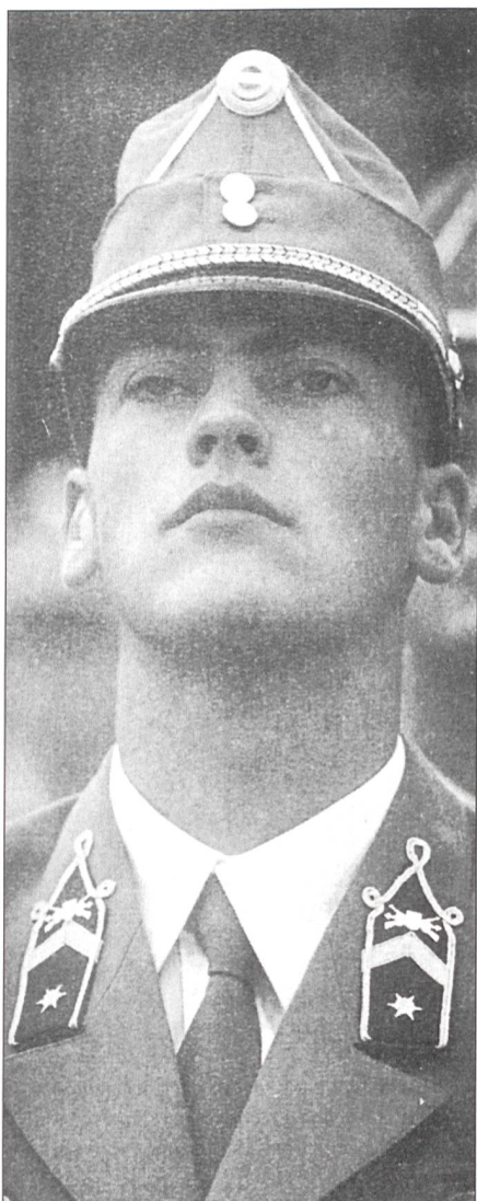
Ungarischer Jungoffizier bei der Ausmusterung.

Wir sprachen nun von der Lage des Offizierskorps. Jährlich benötigt die Honvéd-Armee etwa 450–500 neue Offiziere für alle Waffengattungen. Dazu stehen zwei Militärakademien und eine Universität zur Verfügung und Stipendien, um das Studium im (westlichen) Ausland fortzusetzen. Wir verweilen längere Zeit bei der Frage der Offiziersausbildung. Sie ist in Ungarn auch