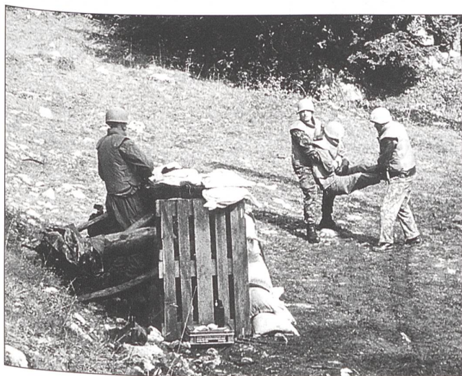
Ein verletzter UNO-Beobachter wird geborgen.