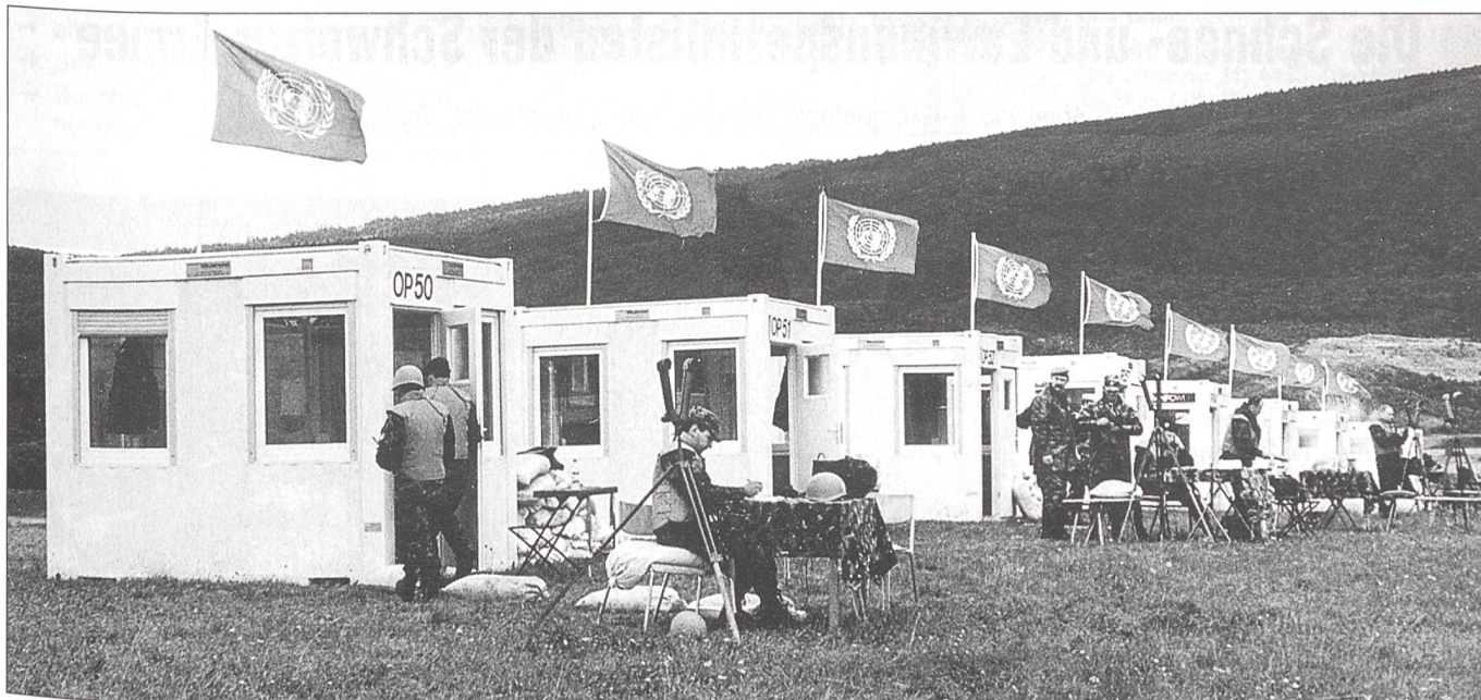
Für die Übung wurden die normalerweise im Gelände stationierten UNO-Beobachtungsposten zusammengezogen.

Zwischenmenschlicher Beziehungen in schwierigen Lagen erkannt und erlebt zu haben.