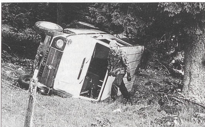
Ein gestohlenen UNO-Beobachter-Fahrzeug baut einen Unfall.