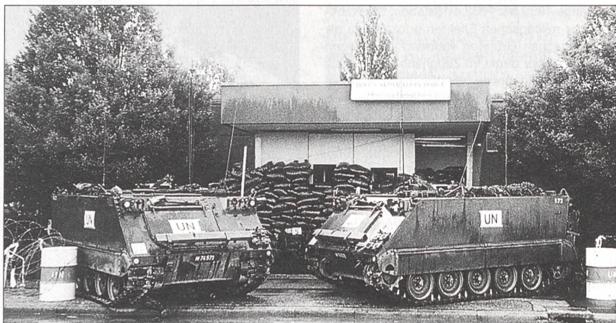
Der gut abgesicherte Kommandoposten der UNO-Beobachter.

Drei Wochen dauerte die Ausbildung zum UN-Beobachter. 37 Offiziere aus 14 Ländern, davon 20 Schweizer, vom Leutnant bis zum Oberst, waren angetreten, um das Handwerk eines UN-Beobachters zu lernen. Das anspruchsvolle und vielseitige Ausbildungspensum musste in insgesamt 128 Arbeits- und Übungsstunden absolviert werden. Zu diesem Zweck wurde in den Jurahöhen das Gebiet von zwei sich feindlich gesinnten Nationen, getrennt durch eine entmilitarisierte Zone, ausgesteckt, durch das ein Kontrollparcours von 72 km Länge als realitätsnahe, mit Hindernissen gespickte Übungspiste führte.