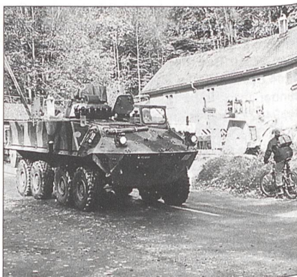
Verschiebung mit dem Radschützenpanzer.

Die meisten Wettkämpferinnen und Wettkämpfer äusserten sich positiv zum Wettkampf und bezeichneten ihn als hart, anspruchsvoll, aber fair.