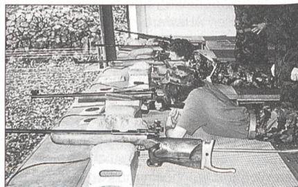
Eine Damenpatrouille beim Kleinkaliberschiessen.

Nachher erwartete ein anspruchsvoller Geländelauf die Patrouilleure, welche diese Aufgabe mit Bravour bestanden.