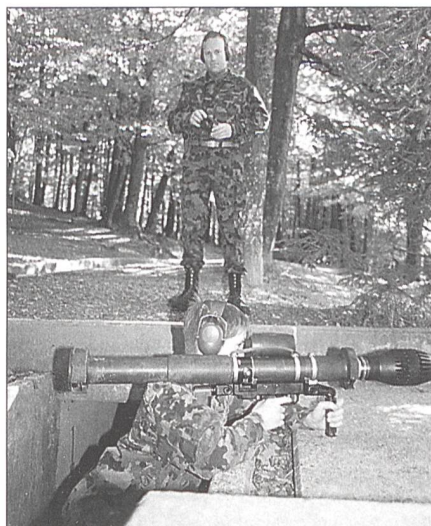
Gut beaufsichtigt übt sich ein Jungschütze im Panzerfaustschieszen.

Ebenfalls im Sand fand im Herbst eine Übung speziell für Jungschützen statt, welche mit 47 Teilnehmern eine ganz tolle Beteiligung hatte. Ziel des «Jungschützertages», an welchem die