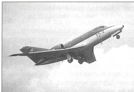
Dassault Falcon 10 MER der französischen Flotte