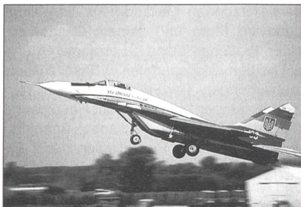
Mikoyan & Gurevich MiG-29 Fulcrum der ukrainischen Luftwaffe