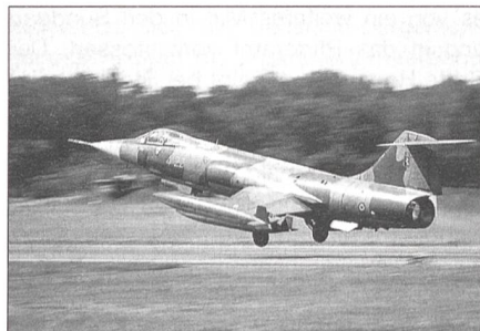
Aeritalia F-104ASA Starfighter der italienischen Luftwaffe