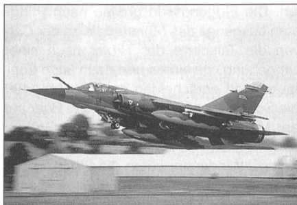
Dassault Mirage F1 der französischen Luftwaffe