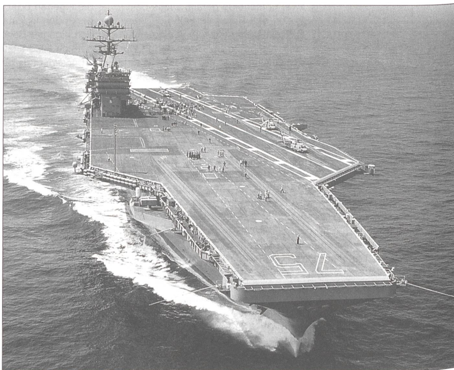
Der neueste Flugzeugträger der US Navy, die «USS Harry S. Truman», auf einer Versuchsfahrt vor der Küste von Virginia. Deutlich kommen die riesigen Ausmasse des über 330 m langen und 77 m breiten Flugdecks zum Ausdruck. Klar zu erkennen sind auch die zwei Katapultbahnen auf dem Vorderdeck und die schräg zur Schiffsachse verlaufende Landebahn. Hier sind zwei weitere Katapulte eingebaut.

Die «USS Harry S. Truman» ist der neunte nukleargetriebene Flugzeugträger der US Navy. Acht dieser Schiffe gehören der «Nimitz»-Klasse an. Ein weiterer Flugzeugträger, die «USS Ronald Reagan» (CVN-76), soll 2002 in Dienst gestellt werden, und für das letzte, noch namenlose Schiff dieser Klasse (CVN-77) sind die ersten Gelder bewilligt worden. Die «USS Harry S. Truman» wird voraussichtlich im Jahre