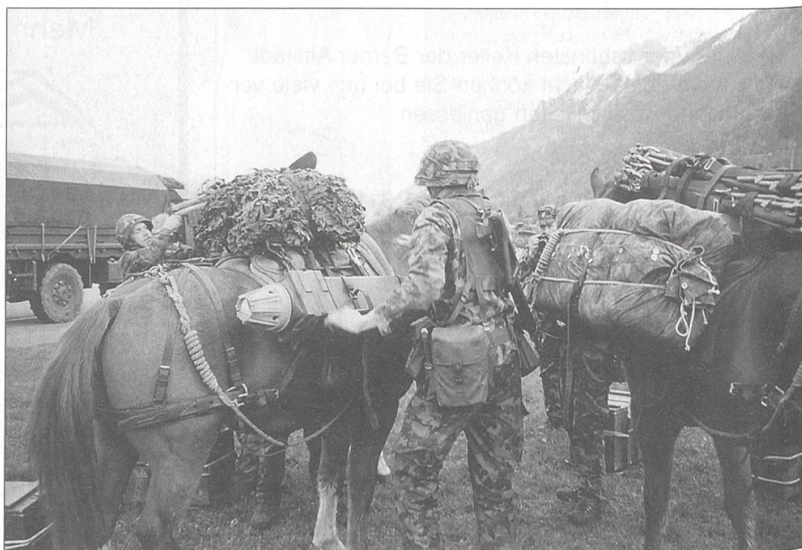
Das vom Helikopter «Super-Puma» herangeflogene Material wird auf die Pferde verladen, um es anschliessend den im Gebirge verstreuten Truppen zu bringen.

fasste Kompaniegefechtsübungen, die Einsatzübung «Condor», Lufttransport mit Helikopter «Super-Puma» und eine alpine Gebirgsübung. Höhepunkt bildete die Katastrophenübung «Pronto», wo die direkte Zusammenarbeit zwischen der Truppe und der Zivilschutzorganisation der Gemeinde Lauterbrunnen geübt wurde. Daneben wurden zusätzlich sowohl der Regimentsstab als auch die Stäbe der Bataillone in besonderen Stabsübungen von ihren vorgesetzten Kommandostellen beübt.