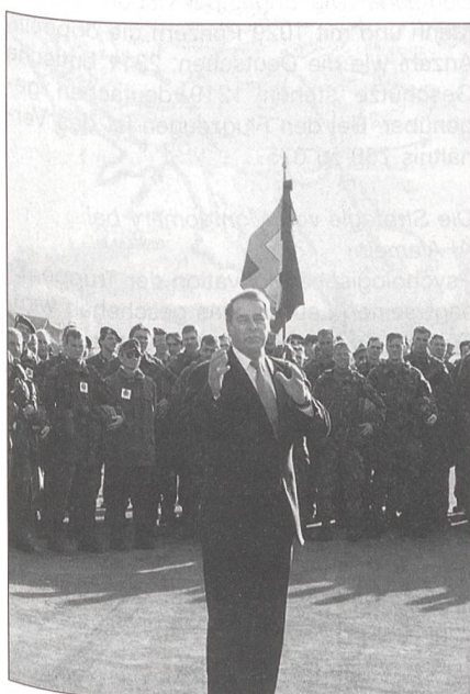
Der Berner Oberländer Bundesrat Adolf Ogi scheint sich unter seinen Oberländer Soldaten sichtlich sehr wohl zu fühlen.