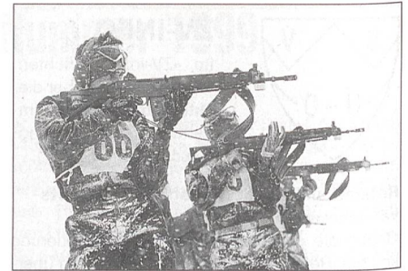
Volle Konzentration bei der Schussabgabe.

Am Samstagmorgen musste der Sportstab der Gebirgsdivision 9 unter der Leitung von Kom-