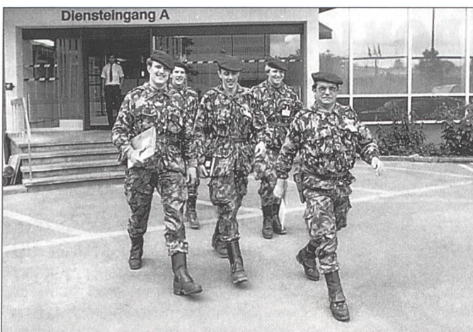
Kdt und Stab vom KP zur Truppe

gen der zu Beginn rund 800 Mann starken Truppe zählten vor allem Bewachungsaufgaben sowie die Unterstützung der zivilen Polizeikräfte. Weil es sich nicht um reine Kampfaufträge handelte, wurden vor allem Wehrmänner im Landsturmalter eingesetzt. Diese leisteten in der Regel jedoch nur eine Dienstleistung unter diesem Kommando. Bis 1986 wurden die Wehrmänner mit jeweils immer neuen Beständen in lediglich fünf Ergänzungskurse einberufen. Das Ausbildungsniveau des Verbandes war dementsprechend tief. Auf der zivilen Seite wurde die Flughafenwache kontinuierlich ausgebaut und nach modernsten Erfahrungen ausgebildet. Auf den 1. Januar 1980 wurde sie in «Flughafensicherheitspolizei» umbenannt. In langen Briefwechseln zwischen zivilen und militärischen Stellen wurde die Frage erörtert, ob die zivile Flughafensicherheitspolizei bei einer Allgemeinen Kriegsmobilmachung dem Flughafen-Kommando unterstellt wer-