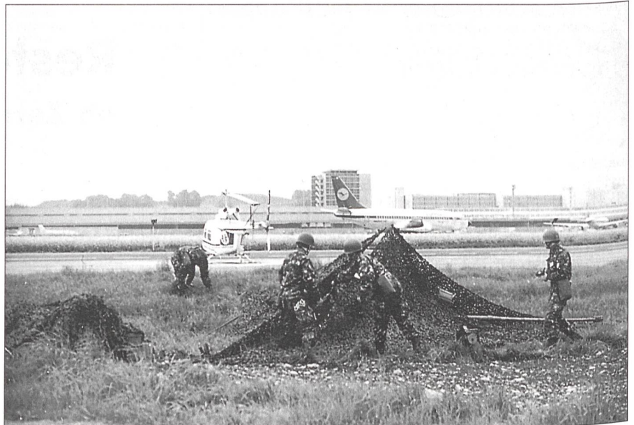
Getarnte Stellung neben ausrollenden Jets.

einem Wüstenflugplatz in Jordanien. Die Entführer forderten die Freilassung der drei in der Schweiz inhaftierten «Befreiungskämpfer», welche im Februar 1969 auf dem Flughafen Kloten eine Boeing 720 B der israelischen Fluggesellschaft EL-AL beschossen hatten. Der Bundesrat sah sich gezwungen, den Forderungen nachzukommen und liess die Attentäter am 1. Oktober 1970 frei. Zu diesem Zeitpunkt hatte die schweizerische Landesregierung bereits die Gesuche der Kantone Zürich und Genf zur Stationierung von Truppen auf den beiden internationalen Flughäfen