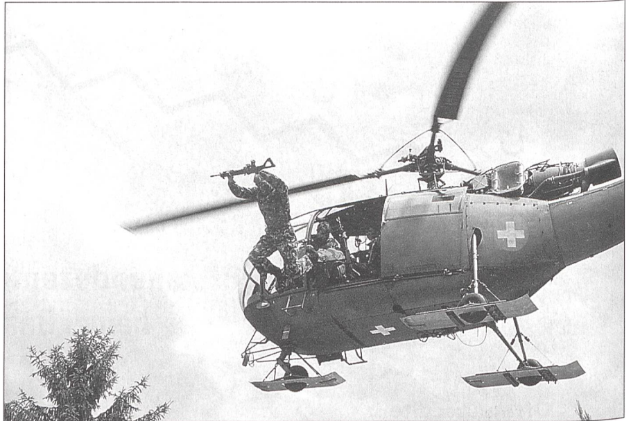
Unsere Milizarmee kann fliegen und springen ...

In modernen Gesellschaften haben sich die Individualinteressen, die Lebensstile auf Kosten des Gemeinschaftlichen ver-