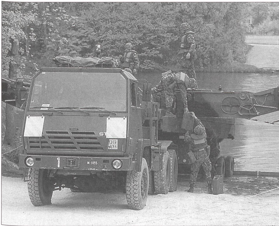
... transportieren und bauen ...

ging. Diese Zusammenarbeit ist muster- gültig gewesen und muss weitergeführt werden. Heute leiden viele ausserdienstliche Vereine unter dem gesellschaftlichen Wertewandel. Zum Glück gibt es noch viele Kräfte, die ihr Traditionsbewusstsein nicht aufgegeben haben. Dazu gehören vor allem die militärischen Dachverbände und Vereine. Sie haben weiterhin eine eminent wichtige Bedeutung. Doch irgendwie kommen sie heute nicht darum herum, ihre Position und Rolle in der sich stark ändernden Gesellschaft zu überdenken und neu zu definieren. Die Arbeit der militärischen Verbände muss an die Veränderungen angepasst und verwesentlich werden. Nur so können gesunde militärische Vereine erhalten werden.