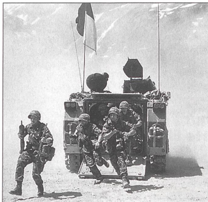
... kämpfen ...

Opfer dieser Entwicklung ist in erster Linie die Armee und die mit ihr verbundenen