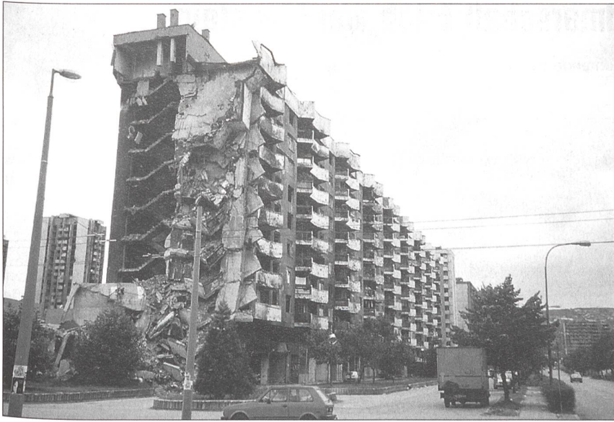
Eingestürztes Haus ganz in der Nähe des Swiss Camp Sarajevo.

Sarajevo. Das Swiss Camp geniesst einen ausserordentlich guten Ruf und dient zahlreichen fremden Kontingentsangehörigen auch als ruhige Zufluchtsstätte. Zu Amerikanern, Österreichern, Franzosen, Deutschen, Ägyptern, Finnen, um nur einige zu nennen, pflegten wir beste Kontakte. Ebenso konstruktive Kontakte bestanden zur Ombudsperson, zum Mine Action Center und zur Delegierten des UNO-Generalsekretärs, Elisabeth Rehn. Als Mitglied des Senior Staff des OSZE-Missionschefs nutze ich v. a. die Empfänge, um das für unsere Unit wichtige Beziehungsnetz zu pflegen und auszubauen.