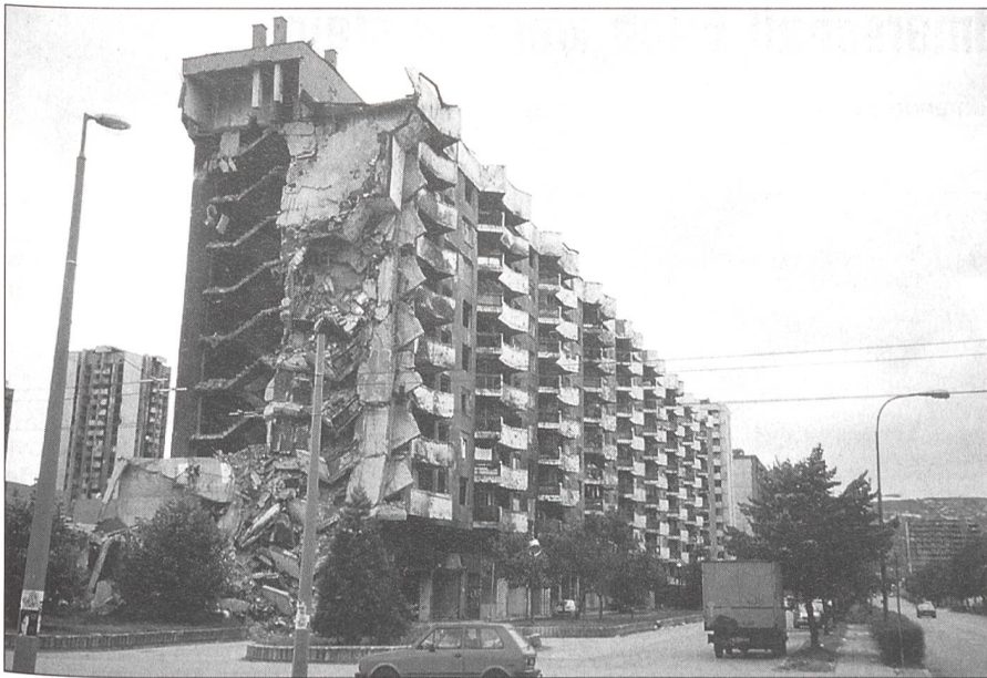
Eingestürztes Haus ganz in der Nähe des Swiss Camp Sarajevo.