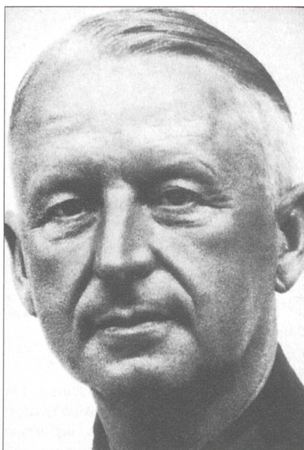
Generalfeldmarschall Erich von Manstein

Im Juli 1935 wurde von Manstein als Chef der Operationsabteilung in den Generalstab des Heeres berufen. Ein Jahr später ist er General, erster Gehilfe des Oberquartiermeisters. Er sollte bald Vertreter des Generalstabschefs Ludwig Beck werden. Seine Laufbahn war bereits zu diesem Zeitpunkt vorgezeichnet. Am 5. November 1937 bestellte Hitler die Oberbefehlshaber der drei Wehrmachtteile, den Kriegsminister und den Aussen-