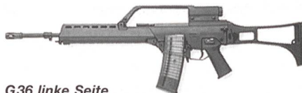
G36 linke Seite