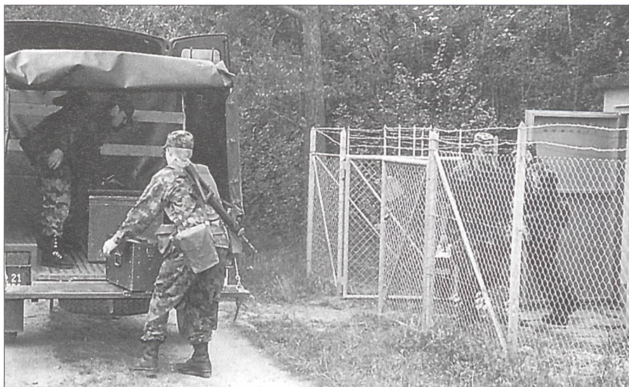
Fassen und Verladen des Objektmaterials im Spr O-Depot durch Fest Pi.